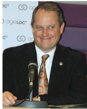
如新集团全球营运总裁邱尔丹