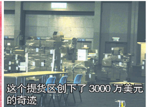
这个提货区创下了 3000 万美元的奇迹

除了他们之外，还有很多销售领袖做了分享。不过记者更为关注的，是如新合伙创办人之一、目前为如新企业集团资深副总裁的戴纯娣女士的分享。