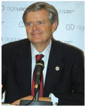
如新集团总裁暨执行长贺楚门