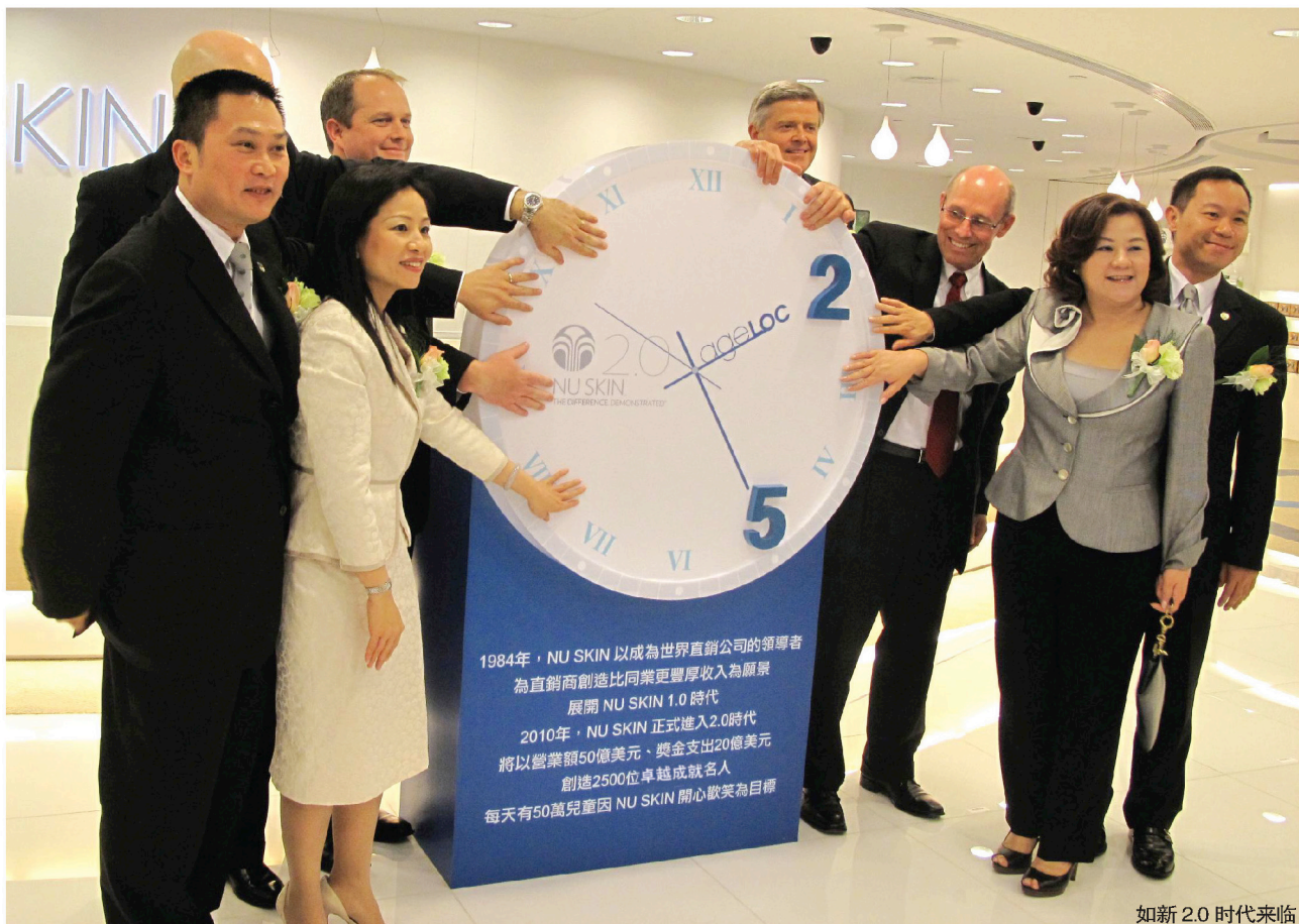
如新 2.0 时代来临